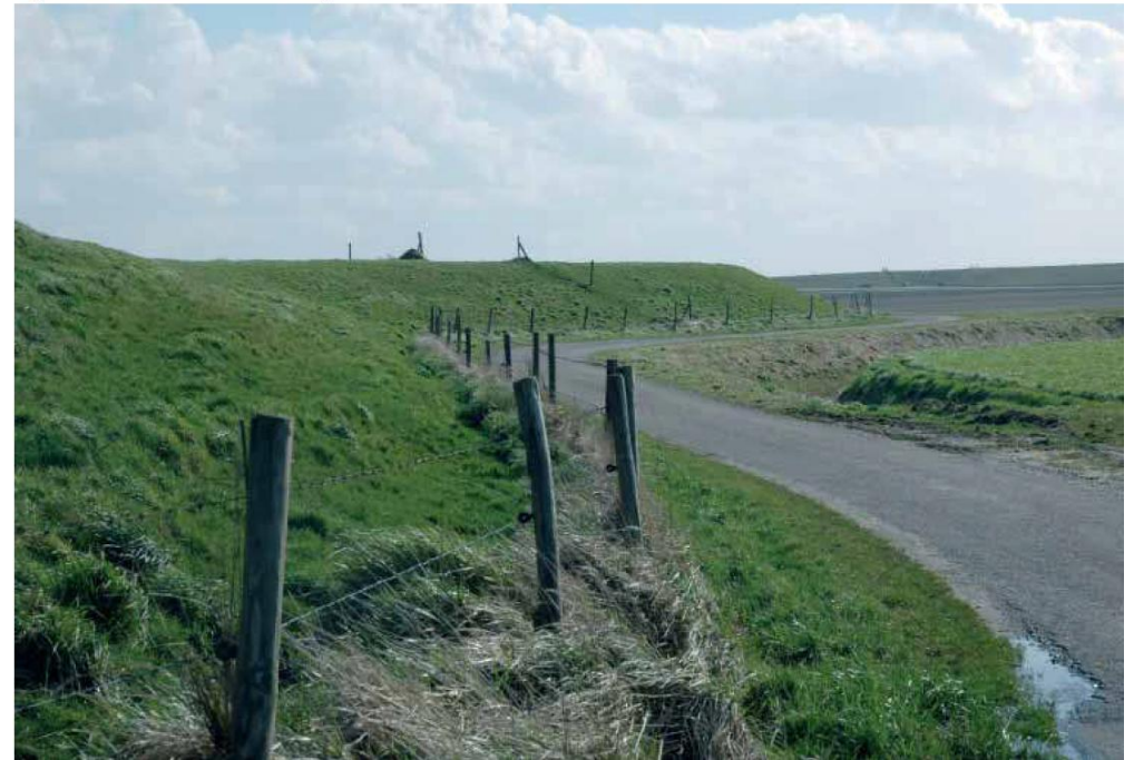
Figuur 5: De kronkelende Groene dijk